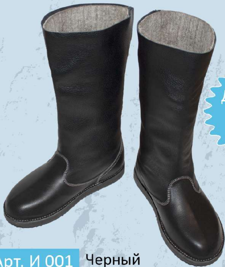
Арт. И 001 Черный