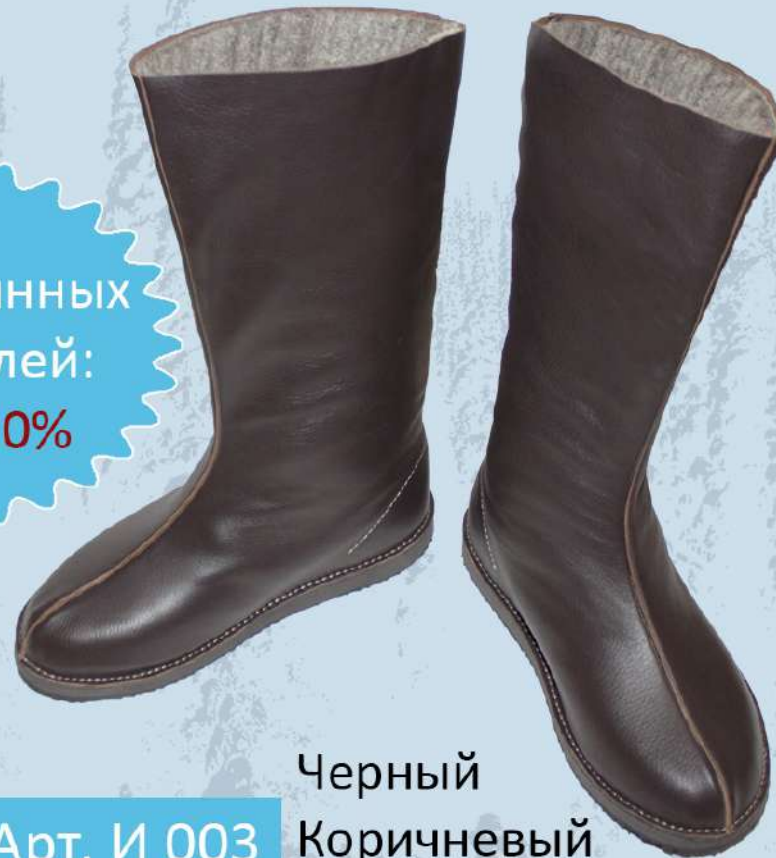
Арт. И 003 Черный Коричневый