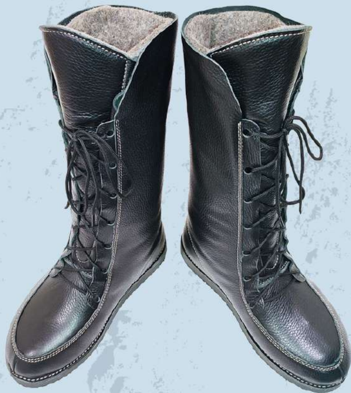
Арт. И 002 Черный